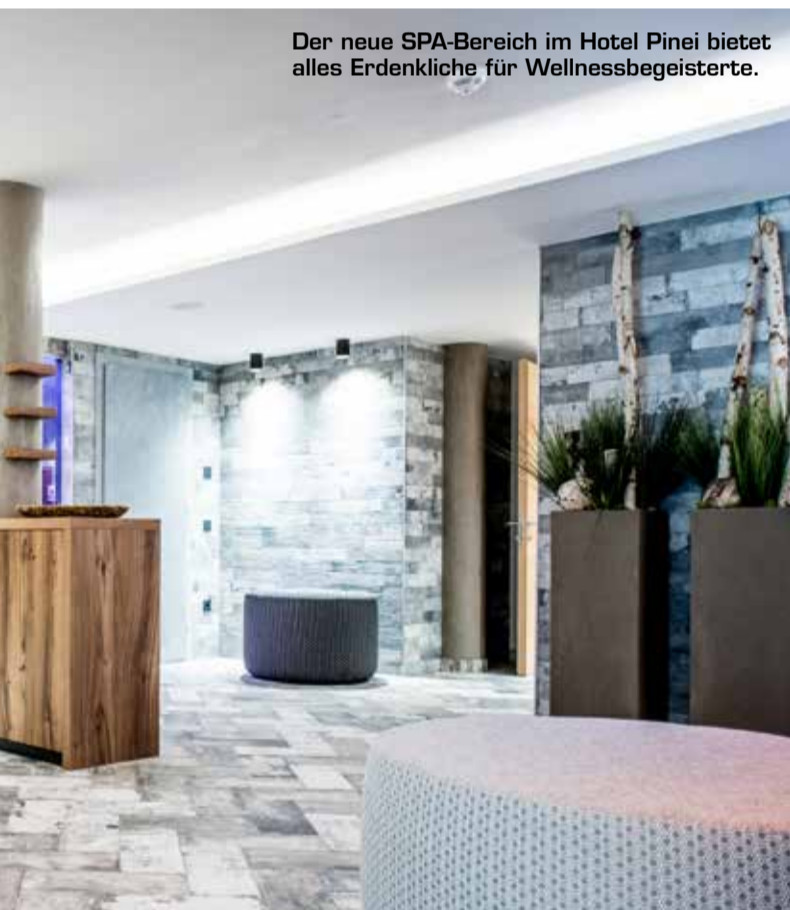
Der neue SPA-Bereich im Hotel Pinei bietet alles Erdenkliche für Wellnessbegeisterte.

Im Winter bietet das Hotel Pinei einen kostenlosen Skibus nach St. Ulrich an. Zudem gibt es jede Woche eine geführte Ski-Tour. Ein Skiraum und nicht zuletzt ein Eislaufplatz mit Schlittschuhen stehen den Gästen ebenso zur Verfügung.