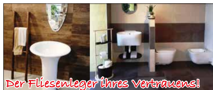
Der Fliesenleger Ihres Vertrauens!