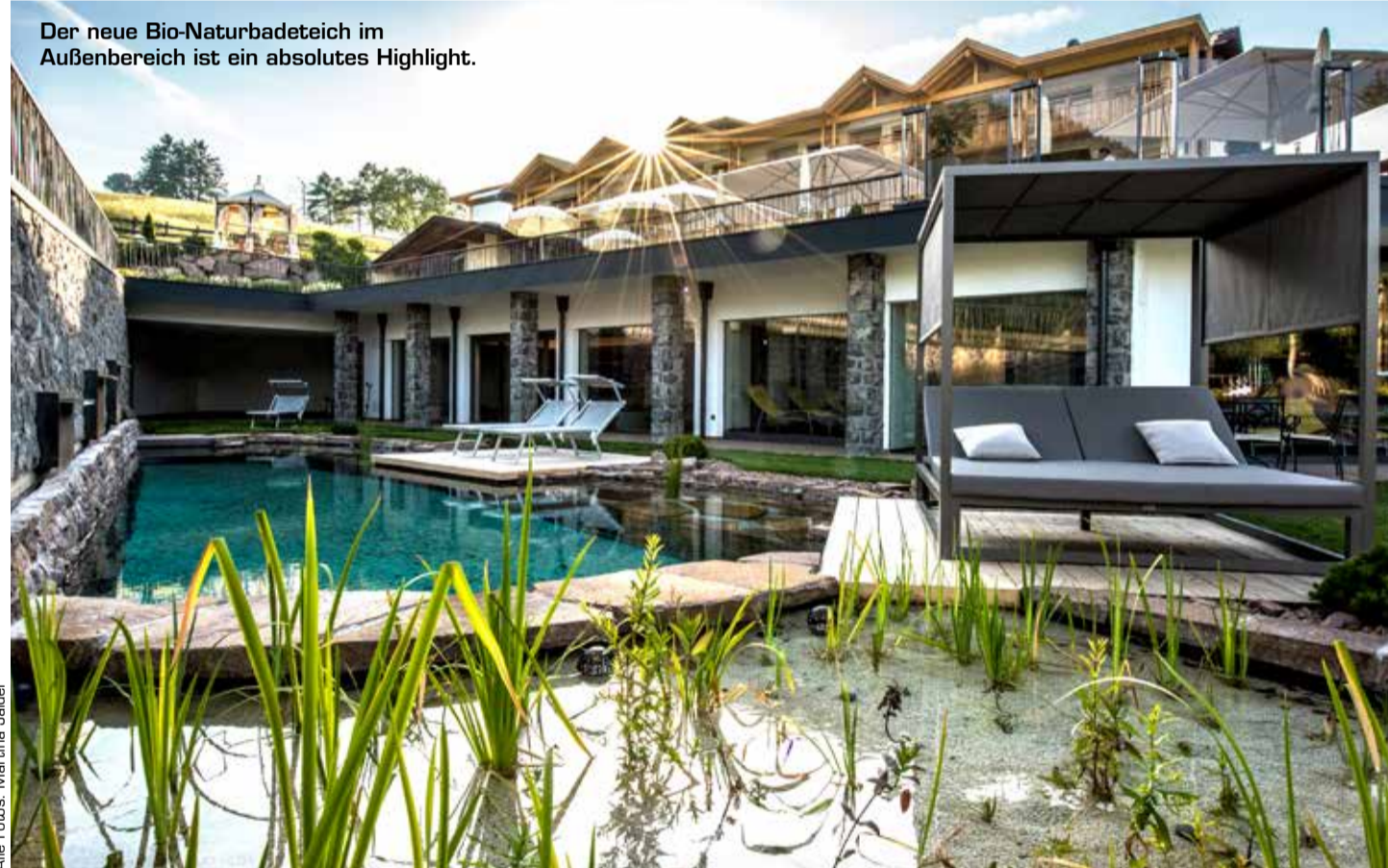
Der neue Bio-Naturbadeteich im Außenbereich ist ein absolutes Highlight.