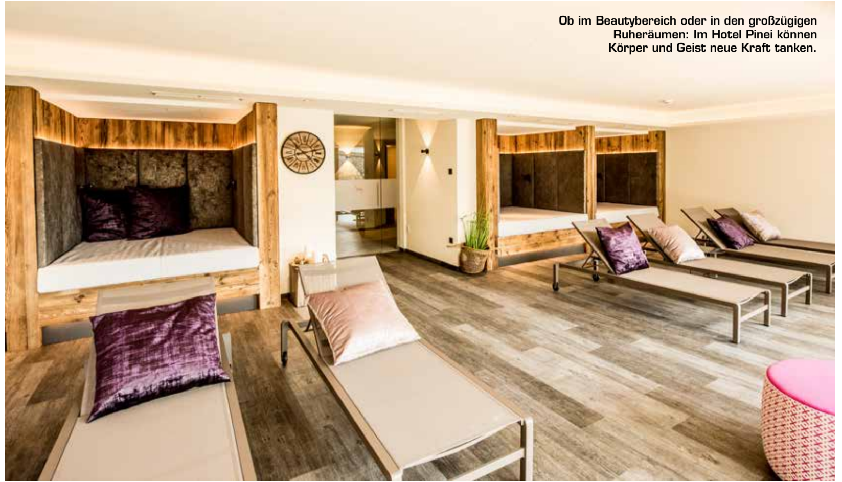
Ob im Beautybereich oder in den großzügigen Ruheräumen: Im Hotel Pinei können Körper und Geist neue Kraft tanken.

warum „Pinei“? Ganz einfach: Südtirol und insbesondere der Panider Sattel weisen eine hohe Anzahl von Kieferngewächsen auf (Lateinisch „Pinus“), und so wurde das Hotel zum Naturhotel Pinei. Ein Name, der somit den Charakter des Hotels und dessen Umgebung sehr gut widerspiegelt.