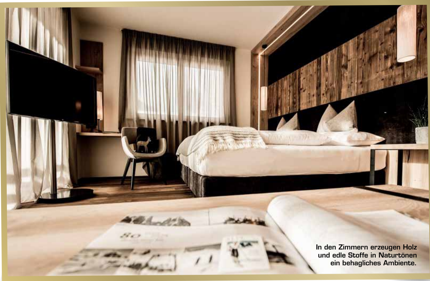
In den Zimmern erzeugen Holz und edle Stoffe in Naturtönen ein behagliches Ambiente.