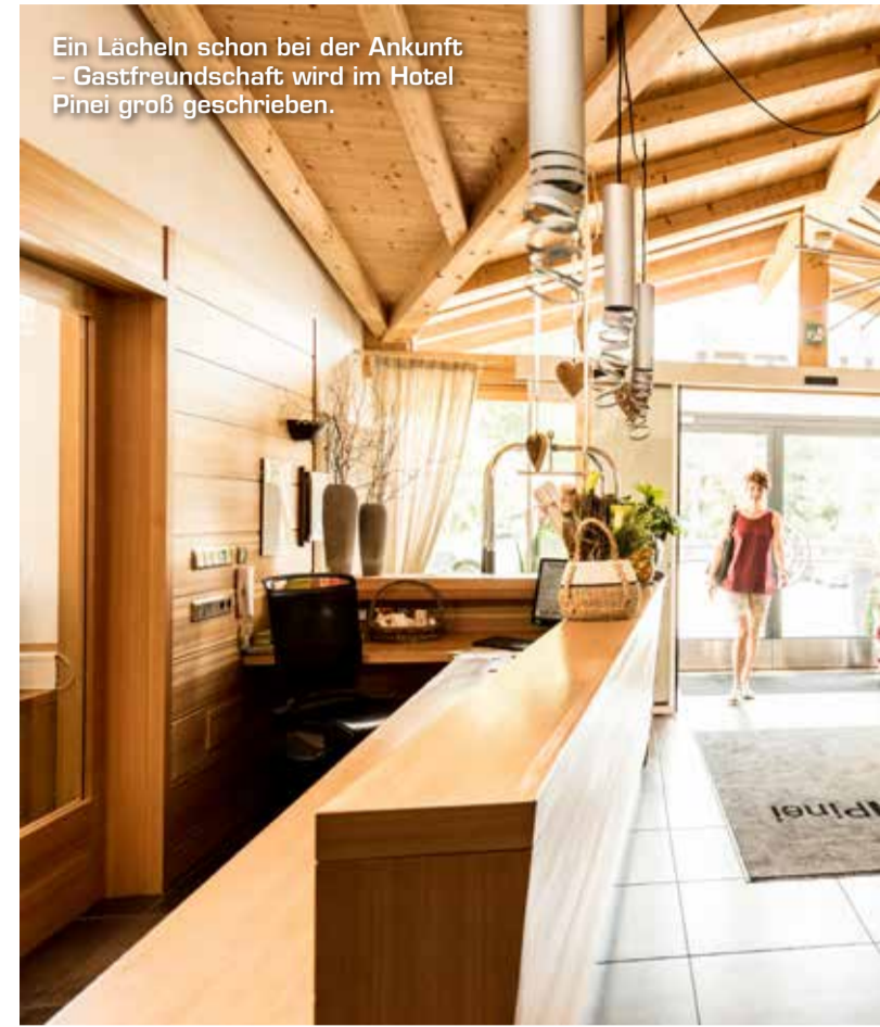
Ein Lächeln schon bei der Ankunft - Gastfreundschaft wird im Hotel Pinei groß geschrieben.

Das Hotel Pinei liegt inmitten einer idyllischen Wald- und Wiesenlandschaft, auf 1440 Metern Höhe, zwischen St. Ulrich in Gröden und Kastelruth, am Fuße der Seiser Alm. Der Panoramablick, den die Gäste vom Zimmer oder von der großen Hotelterrasse aus genießen können, ist grandios.