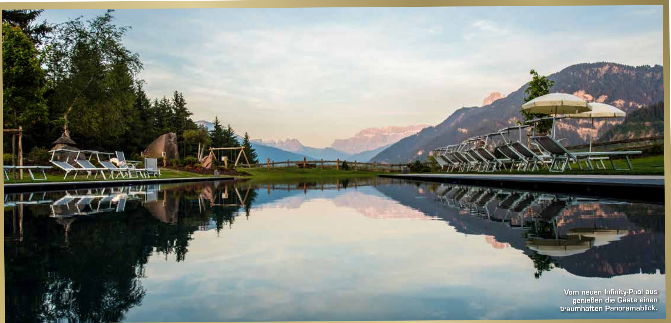
Vom neuen Infinity-Pool aus genießen die Gäste einen traumhaften Panoramablick.