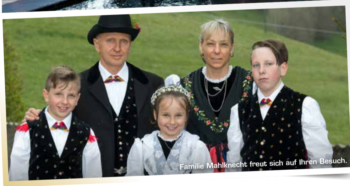
Familie Mahlknecht freut sich auf Ihren Besuch.

Sie suchen ein gemütliches Familienhotel mit neuem SPA-Bereich und einer ganz besonderen Form von herzlicher Gastfreundschaft? Dann sind Sie im Vier-Sterne-Hotel Pinei am Panider Sattel garantiert richtig.