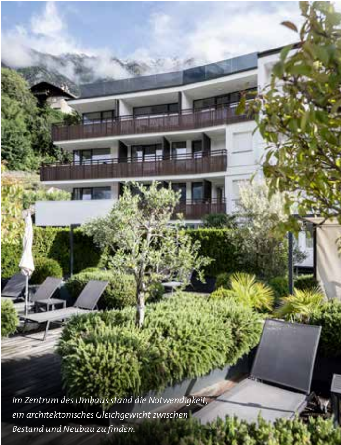
Im Zentrum des Umbaus stand die Notwendigkeit, ein architektonisches Gleichgewicht zwischen Bestand und Neubau zu finden.

Erholung ist oberste Maxime im Vitalpina 4-Sterne-Hotel Belvedere in Naturns. Ob aktiv sein in der Frischluft oder grundlegend entspannen – die Gastgeberfamilie Tappeiner steht für Bodenständigkeit und sicheres Urlaubsgefühl. Und das in einem bewusst sowie zielgerecht umgebauten Haus.