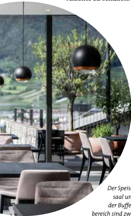
Der Speisesaal und der Buffetbereich sind zwei wesentliche Bereiche, die neu gestaltet wurden.