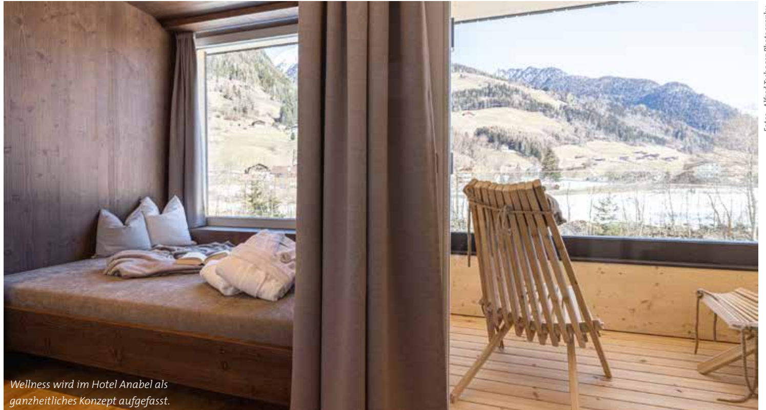
Wellness wird im Hotel Anabel als ganzheitliches Konzept aufgefasst.

pro Person und Nacht im neuen Doppelzimmer „Aue“