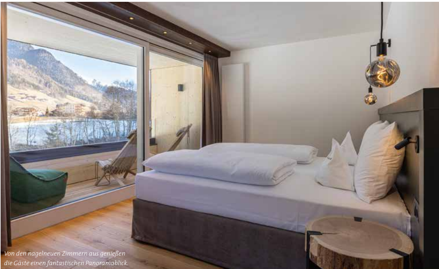
Von den nagelneuen Zimmern aus genießen die Gäste einen fantastischen Panoramablick.