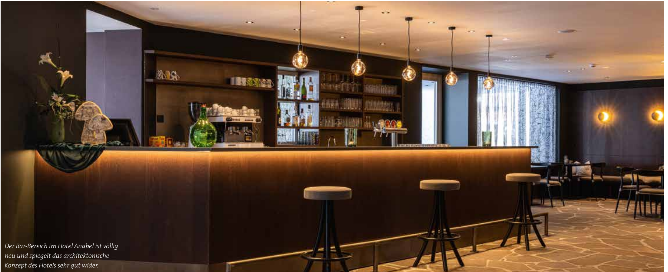
Der Bar-Bereich im Hotel Anabel ist völlig neu und spiegelt das architektonische Konzept des Hotels sehr gut wider.