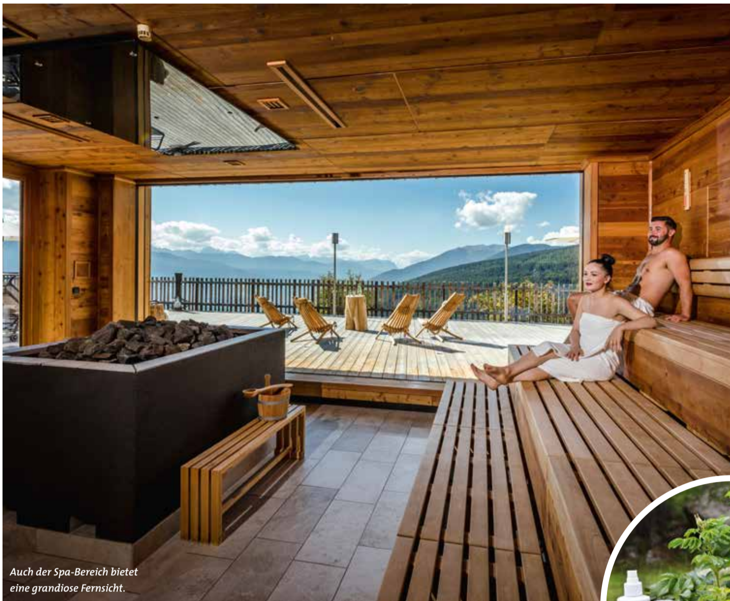
Auch der Spa-Bereich bietet eine grandiose Fernsicht.