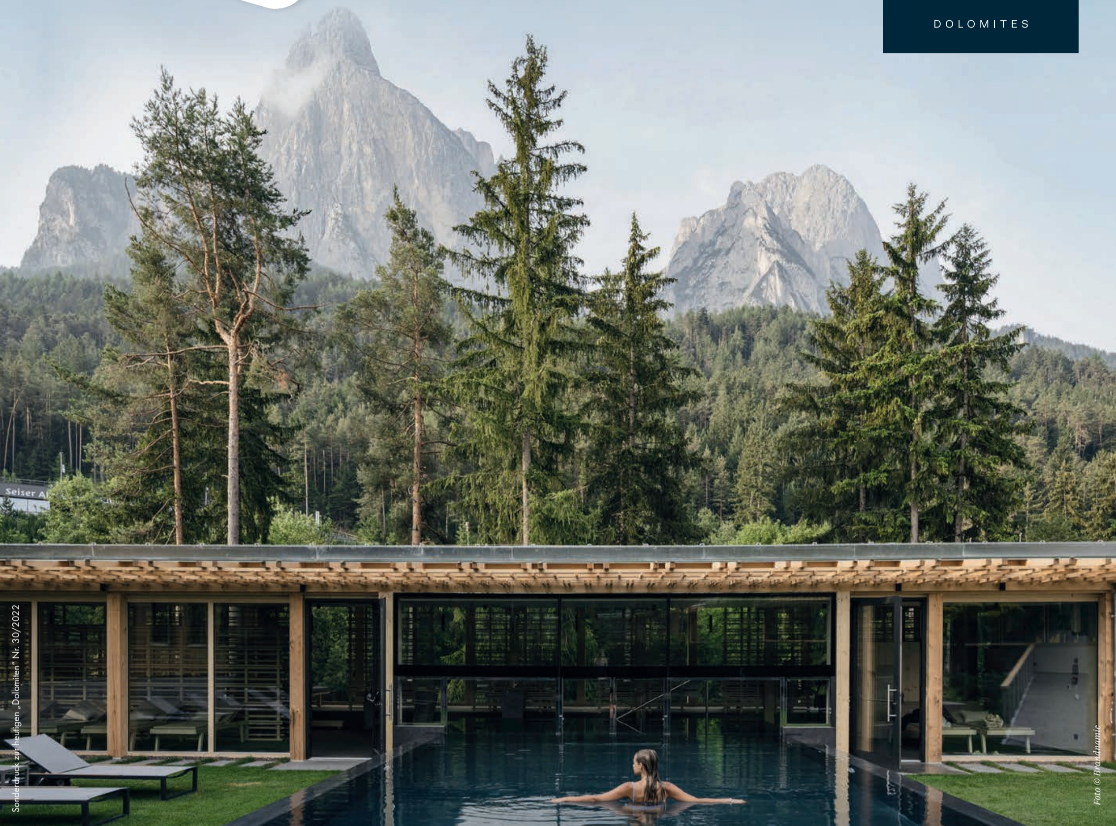
Sonderdruck zur heutigen „Dolomiten“ Nr. 30/2022